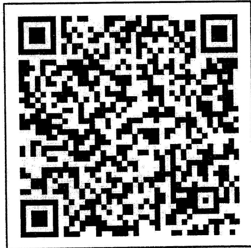
สแกน QR-Code เพื่อสมัครเข้าประกวด